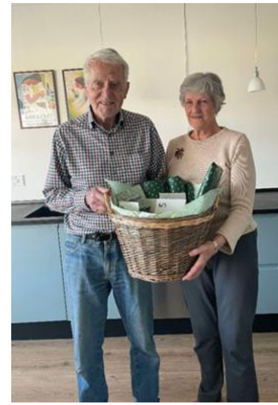
Pakkekalender fra vores dejlige børnebørn.