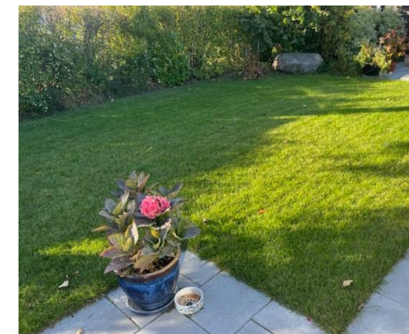
Vores have - før og efter