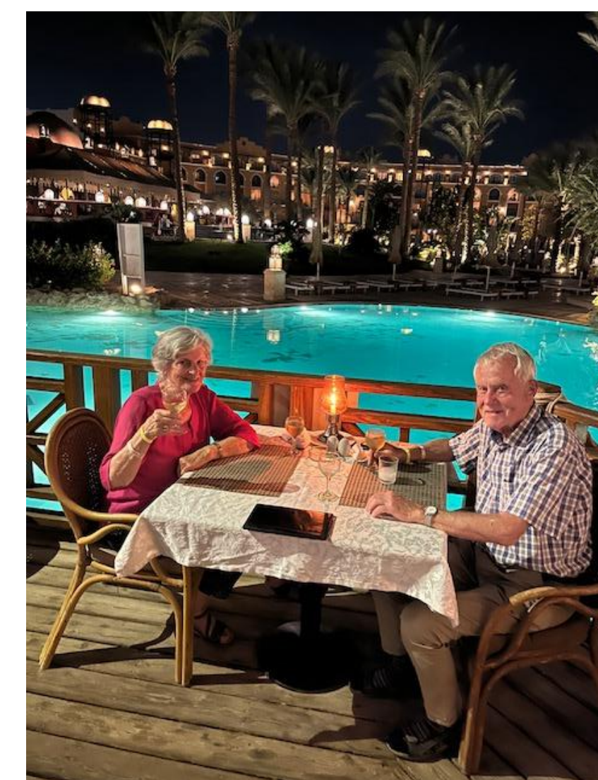
Egypten i november, dejligt.