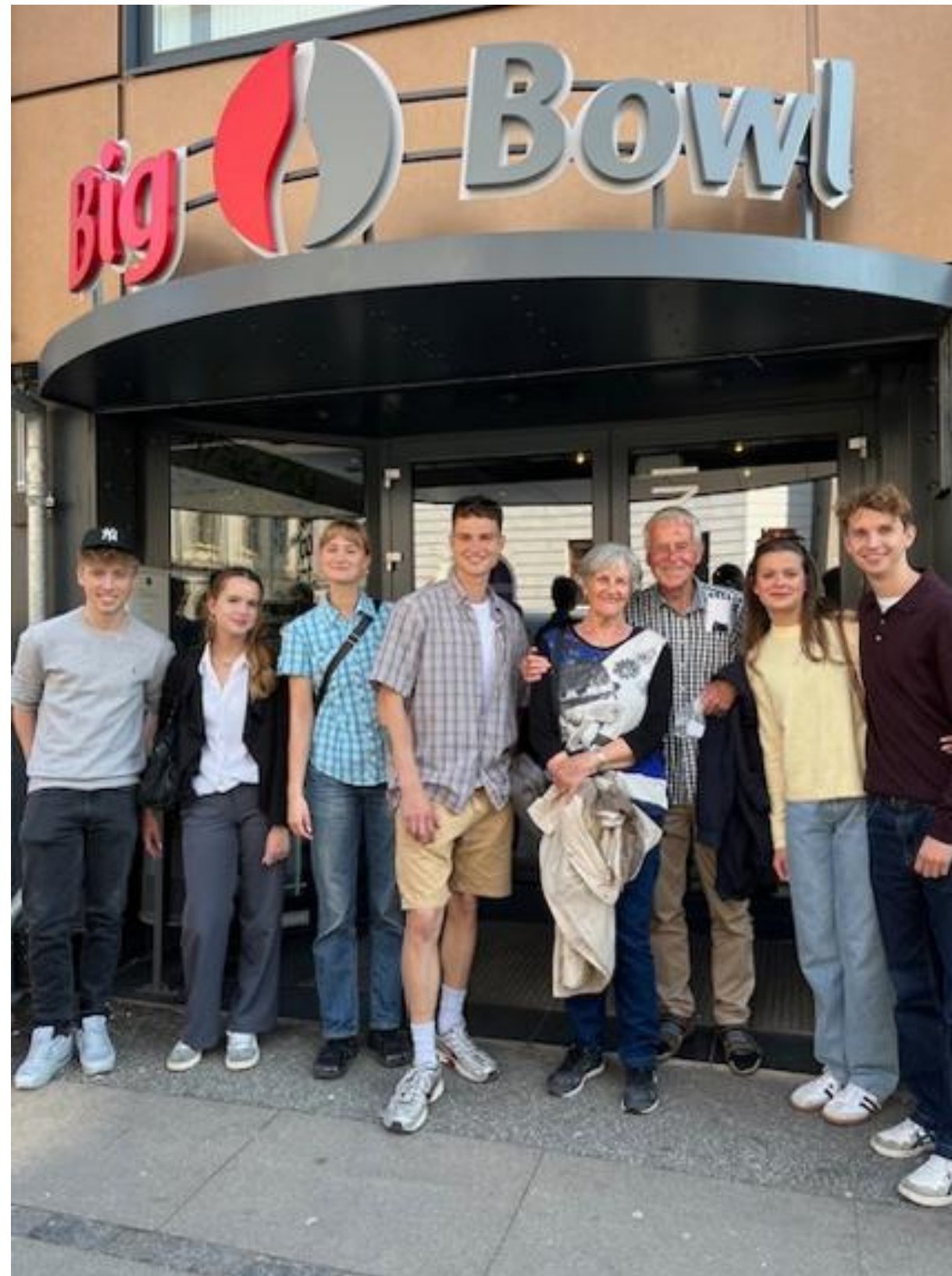
Bowling med alle børnebørn med kærester