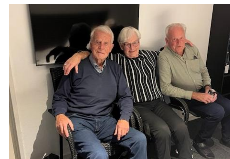
Tre søskende sammen på Vadehavshotellet.