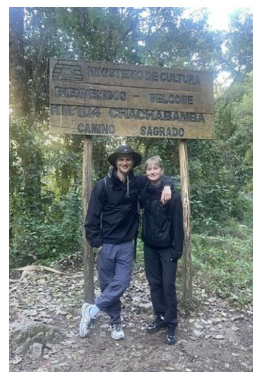
Og vandretur i Amazonen